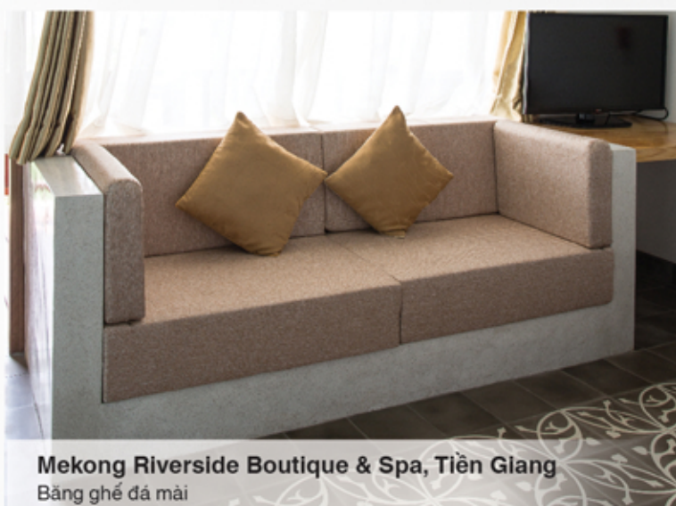
Mekong Riverside Boutique & Spa, Tiền Giang Băng ghế đá mài