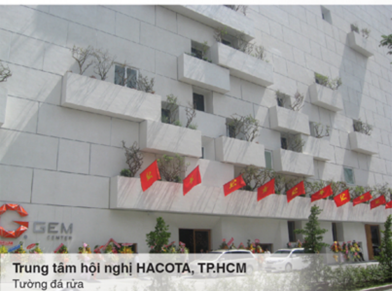
Trung tâm hội nghị HACOTA, TP.HCM Tường đá rửa