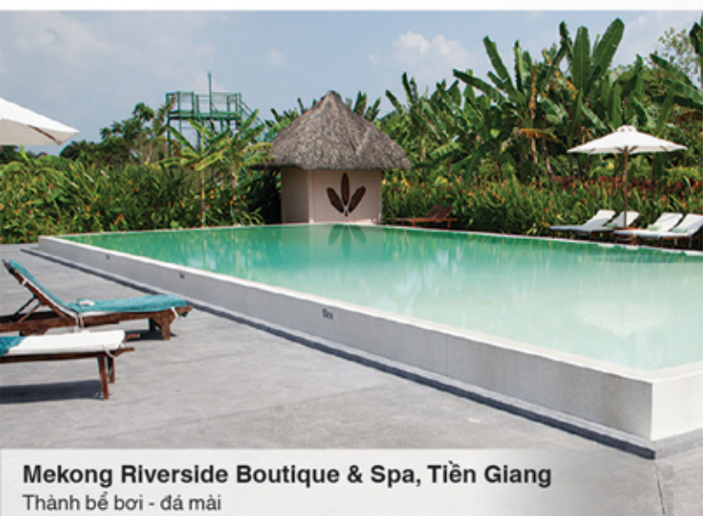
Mekong Riverside Boutique & Spa, Tiền Giang Thành bể bơi - đá mài