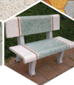
Bàn ghế đá