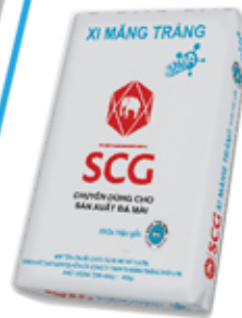
SCG EXTRA CHUYÊN DÙNG CHO SẢN XUẤT ĐÁ MÀI