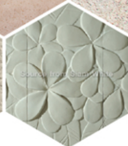
Xi măng trang trí tường