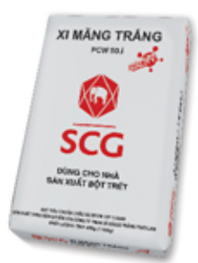
SCG PCW50.I DÙNG CHO NHÀ SẢN XUẤT BỘT TRÉT