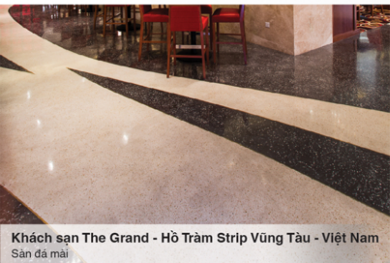
Khách sạn The Grand - Hồ Tràm Strip Vũng Tàu - Việt Nam Sàn đá mài