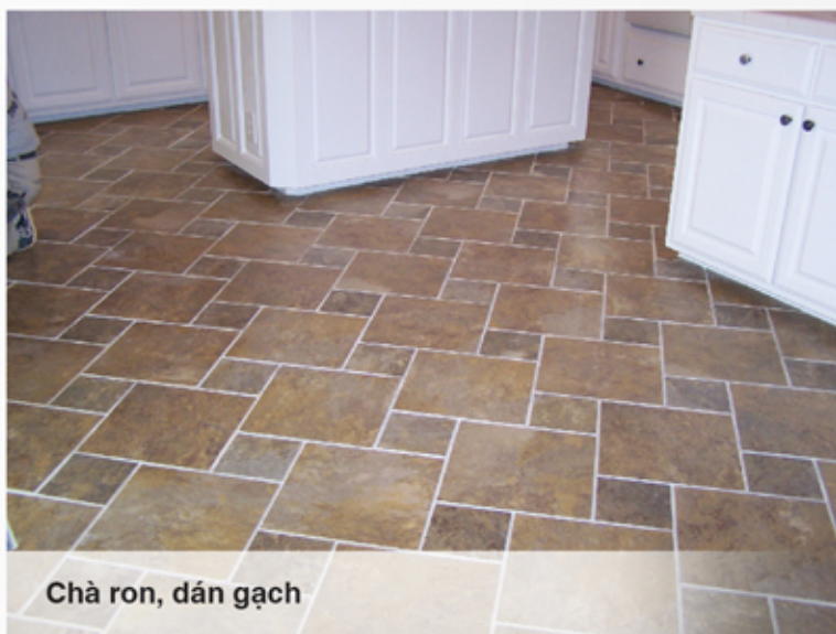
Chà ron, dán gạch