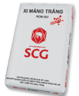
SCG PCW50.I - THƯỢNG HẠNG