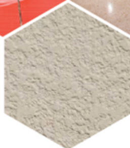
Bột trét tường