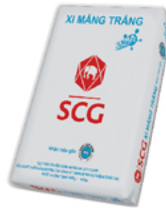
SCG EXTRA - CAO CẤP