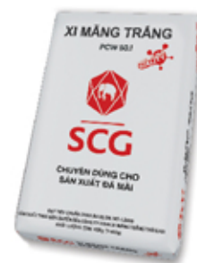
SCG PCW50.I CHUYÊN DÙNG CHO SẢN XUẤT ĐÁ MÀI